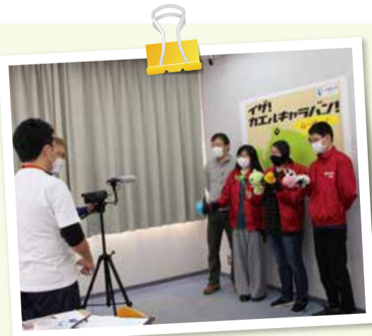
主催:花園大学 制作:花園大学地域連携教育センター 協力:NPO法人プラス・アーツ/中京区役所/右京区役所/左京区役所