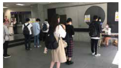
▲写真は、チケット引換所での学生たちの様子です。

あらかじめ郵送された「引換券」と学生証提示で、1万2千円分のチケットと交換します。チケット引換所では、深々とお礼を言って受け取る学生の姿、チケットを手にするや食堂に直行する学生の姿、普段買えなかった本やグッズを買い求める姿など、一様に笑顔が見られ、キャンパスにも以前のような活気が戻ってきました。